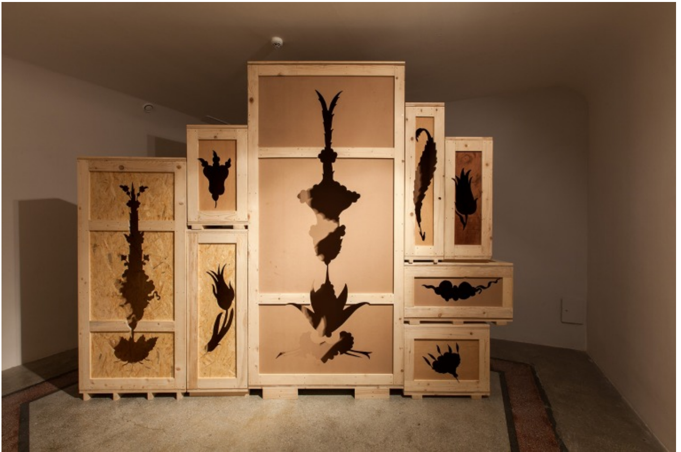
[1] וואליד ראאד, מכתב נוסף לקורא 2015, צילום Eren Ugur Sahir באדיבות IKS

הצעה אמנותית עלולה להפוך לברברית, כאשר היא דידקטית, אילוסטרטיבית, או מילולית גרידא. להבדיל, המהלכים האמנותיים החזקים בביאנלה הם דווקא פיקטיביים במופגן. המיצב מכתב נוסף לקורא (2015) של וואליד ראאד (Raad), למשל, פותח בבדיה הבאה: בשלהי שנת 1914 שר המלחמה הטורקי הורה לאחסן מאות מוטיבים מהעיר איזניק (İznic) שנחשבו בסכנת הכחדה ו/או כדי להגן עליהם מנזקים בשעת מלחמה. המוטיבים נארזו ונשמרו בכספות בנקים ברחבי איסטנבול, אך בדיעבד הסתבר שהם חמקו החוצה בזמן המלחמה. על פי הכתוב, אחרי המלחמה רבים מנציגי הממשלה האשימו את המוטיבים בבגידה ובחתרנות וביקשו להעמידם למשפט צבאי, ורק מעטים הבינו שלמעשה הם עזבו את מקלטיהם בחיפוש אחר צבעי הכחול, הירוק והאדום אשר נטשו אותם. המיצב נמצא בכספת במרתפו של בניין שנבנה במקור עבור בנק, אותה ראאד מילא בארגזים ריקים, שמדפנות כל אחד חתך מוטיב עיטורי אחר. המוטיבים המדוברים ממלאים את הכספת בהיעדרם, כבהיפוך לרעיון המסר בבקבוק: במקום שהמיכל ישא את המסר עבור קורא עתידי שסוף סוף ימצאו ויחלצו, המסר פרץ את גבולות המיכל והתפזר לכל הרוחות, בהשאירו אחריו חור. כאשר תיאודור ו. אדורנו טבע את מושג "המסר בבקבוק" בזמן גלותו בארה"ב, בשעה בה היה ברור שאין בנמצא נמען לכתביו הביקורתיים בגרמניה הנאצית, הוא תיאר שלא יימצא קורא למסריו. 4.אולם, במטאפורה שהציע לא העלה על הדעת את האפשרות שלא הקורא יתחמק מהמסר, כי אם המסר כבר חמק מהבקבוק שבידי הקורא המשתוקק. במיצב, הנוכחות בתור היעדר היא כתמונת תשליל של היעדרות אותה כופה הארכיב על המסמכים אותם הוא משמר, ולדברי ז'אק דרידה, בו-בזמן, גם גונז. 5.ז חגיגת כישלון הארכיון.