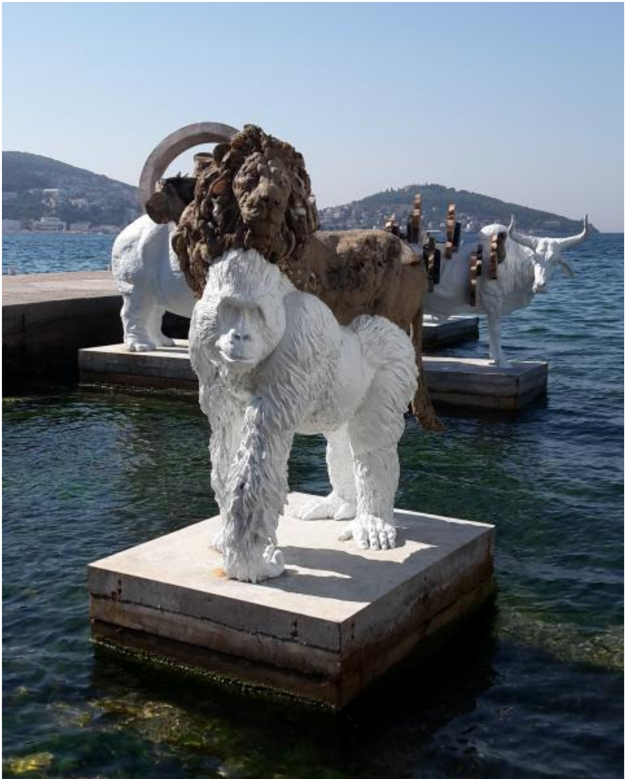
[7] אדריאן וישאר רוחאס, היפה מכל האמהות 2015

לבסוף תיבת נח עוגנת במוזיאון. באיסטנבול מודרן, המוזיאון לאמנות עכשווית, אצרה כריסטוב-בקרטיב תערוכה קבוצתית אשר חובקת אמנים עכשוויים כמו גם דמויות בנות המאה ה-19 וה-20, ומציגה עבודות חדשות לצד ישנות ואף כאלה שיוצרו מחדש לכבוד הביאנלה. התערוכה אוספת מסרים שעלולים היו להיעלם בנסיבות היסטוריות שונות של מבול, עליהן מעידות